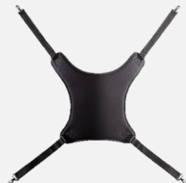
4ポイントショルダー ストラップ CH P01 A01