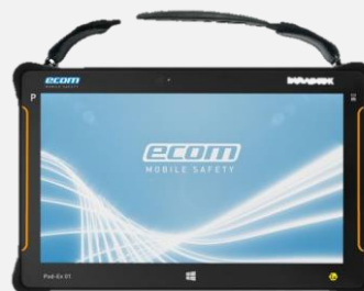
ハンドストラップ CA P01 A01 (※1)