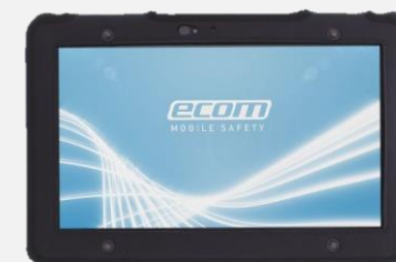
皮製ケース LC P01 A01

※バッテリーチャージャー、ドッキングステーションをご使用の際は本体付属のACアダプター・ケーブルをご利用下さい。