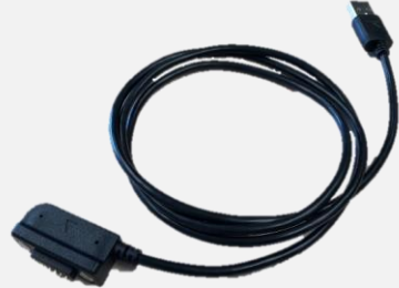
充電ケーブル PC S02 (※1)