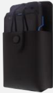
皮製ホルスター LH S02