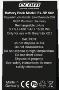
バッテリーパック EX-BP S02 (※1)