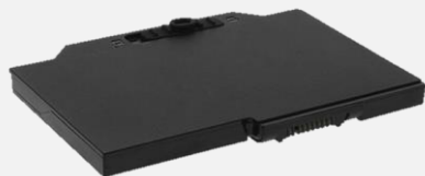
スペア電源 3950mAh BP P01 SC (※1)