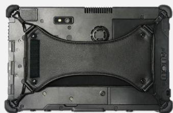
Xストラップ HA P01 A01