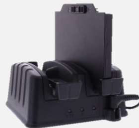
バッテリーチャージャー DC P01 HC