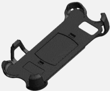
クレードル CR-EX S02

※格納可能ストラップRL ID01をご使用の際はMINI QD LOOPが必要になります。