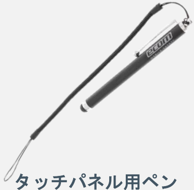
タッチパネル用ペン ST 01