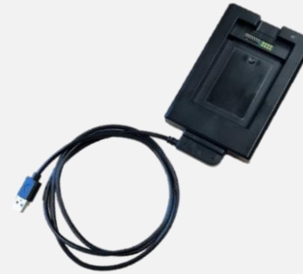
バッテリーパックチャー ジャー DC EX-BP S02

※バッテリーパックチャージャーにはケーブルは付いていません。本体付属のケーブルをご利用下さい。