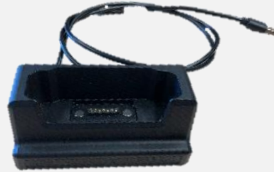
ドッキングステーション DS S02