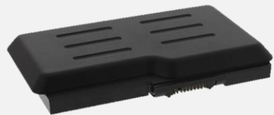
スペア電源 7800mAh BP P01 HC