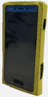
皮製ケース LC S02