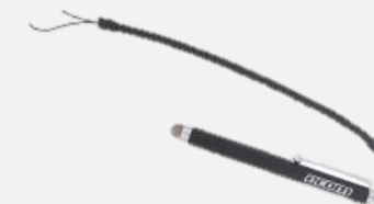
ストラップペン ST T01 X1i