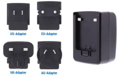
ACアダプタ TC S02 Travel Charger (※1)

※バッテリーパックチャージャーにはケーブルは付いていません。本体付属のケーブルをご利用下さい。