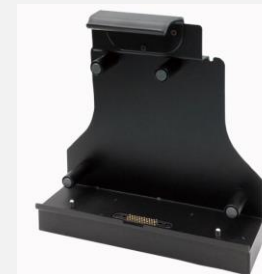
ドッキングステーション DS P01 A01