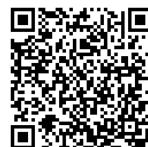
(リンク先：日本スウェージロック FST株式会社)